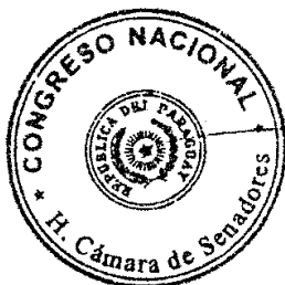
Carlos Filizzola En ejercicio de la Presidencia H. Cámara de Senadores

A Su Excelencia Señor Hugo Adalberto Velázquez Moreno , Presidente Honorable Cámara de Diputados Poder Legislativo