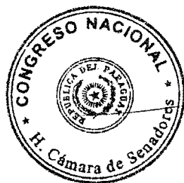
Carlos Filizzola En ejercicio de la Presidencia H. Cámara de Senadores

A Su Excelencia Doctor Luis María Benítez Riera , Presidente Corte Suprema de Justicia Palacio de Justicia