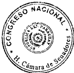
Carlos Filizzola En ejercicio de la Presidencia H. Cámara de Senadores

DADA EN LA SALA DE SESIONES DE LA HONORABLE CÁMARA DE SENADORES DE LA NACIÓN, A LOS QUINCE DÍAS DEL MES DE JUNIO DEL AÑO DOS MIL DIECISIETE.